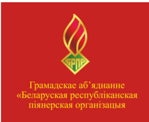
Знамя ОО «БРПО» (лицевая сторона)