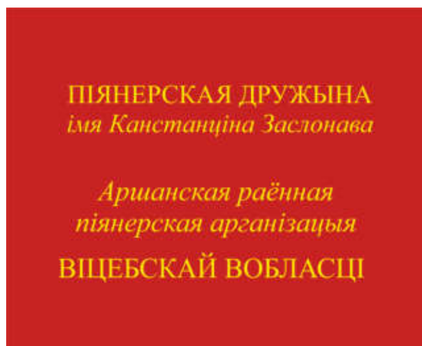
Знамя пионерской дружины (оборотная сторона)