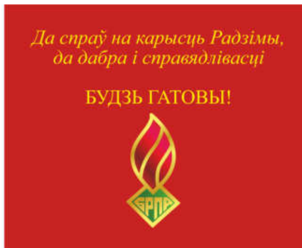
Знамя ОО «БРПО» (оборотная сторона)