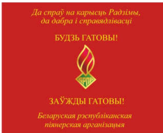
Знамя областной (Минской городской) пионерской организации (лицевая сторона)