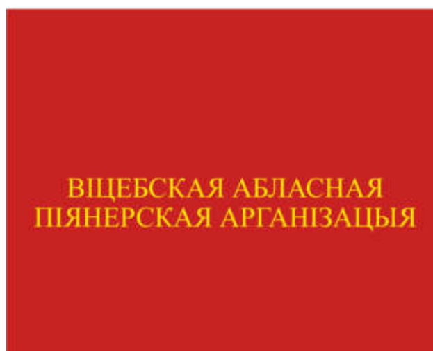
Знамя областной (Минской городской) пионерской организации (оборотная сторона)