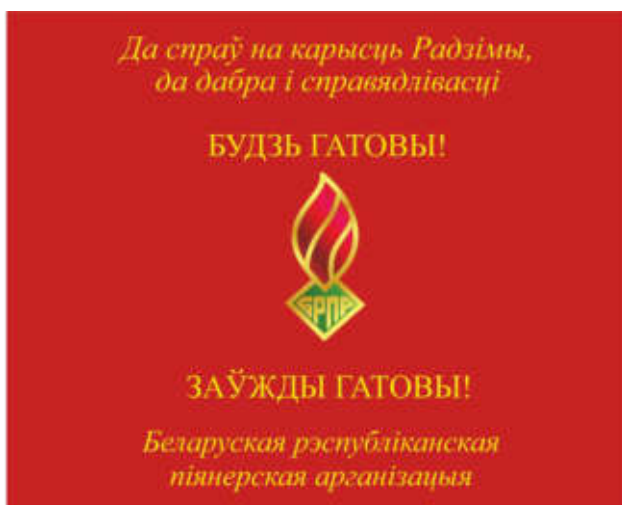
Знамя пионерской дружины (лицевая сторона)